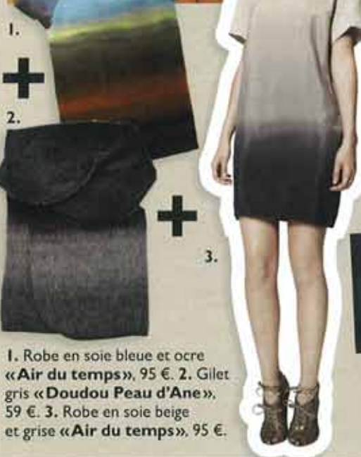
1. Robe en soie bleue et ocre «Air du temps», 95 €. 2. Gilet gris «Doudou Peau d'Ane», 59 €. 3. Robe en soie beige et grise «Air du temps», 95 €.

Peau d'Ane , par Anne Valérie Hash, d'après le conte de Charles Perrault (Sublime Edition, 14 €), en vente dès le 19 novembre chez Monoprix, et le 26 en librairie.