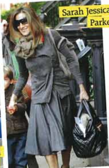
Sarah Jessica Parker